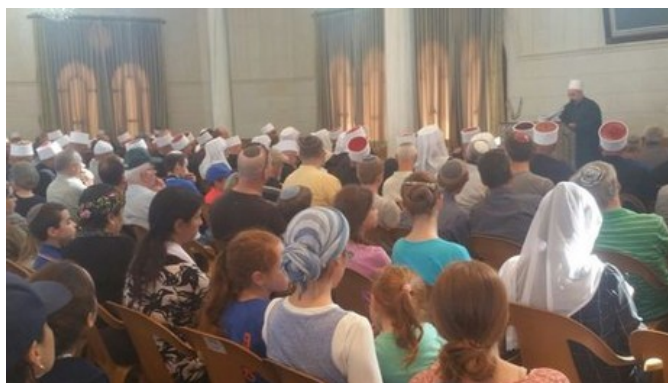
"אחים אנחנו". הביקור בבני שועייב.

בכירי העדה הדרוזית בישראל בראשות המנהיג הרוחני, שייח מופק טריף, אירחו היום (ג') בסוכה מיוחדת שנבנתה בבני שועייב את קהילת בית הכנסת 'ש"י עגנון' וקהילת 'ארנונים', בביקור גומלין, בעקבות האירוח שערכו לבני העדה הדרוזית לפני כששעה חודשים, לאות הזדהות בצער משפחת השוטר זידאן סייף שנהרג בפיגוע בשכונת הר נוף בירושלים.